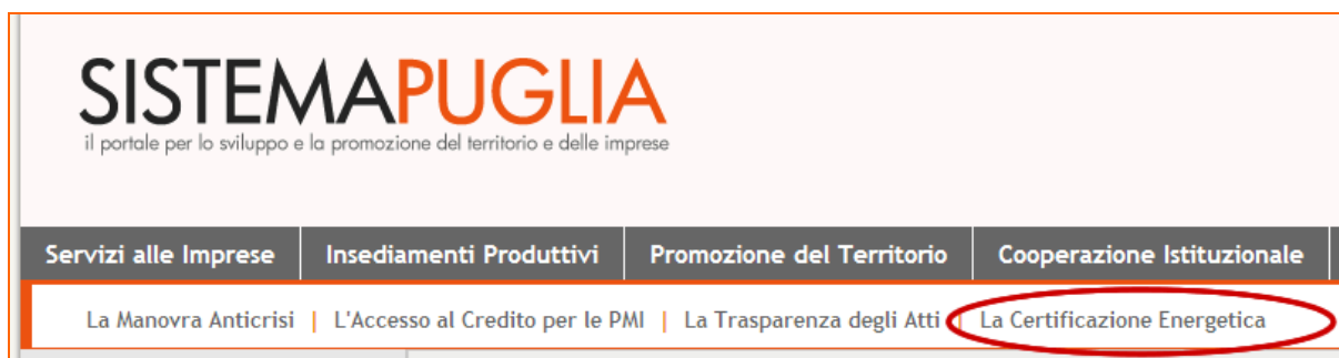
Figura 1 - Punto di accesso alla sezione La Certificazione Energetica

La procedura è disponibile nella pagina La Certificazione Energetica - link posto nella barra di menu orizzontale di secondo livello della home del portale.